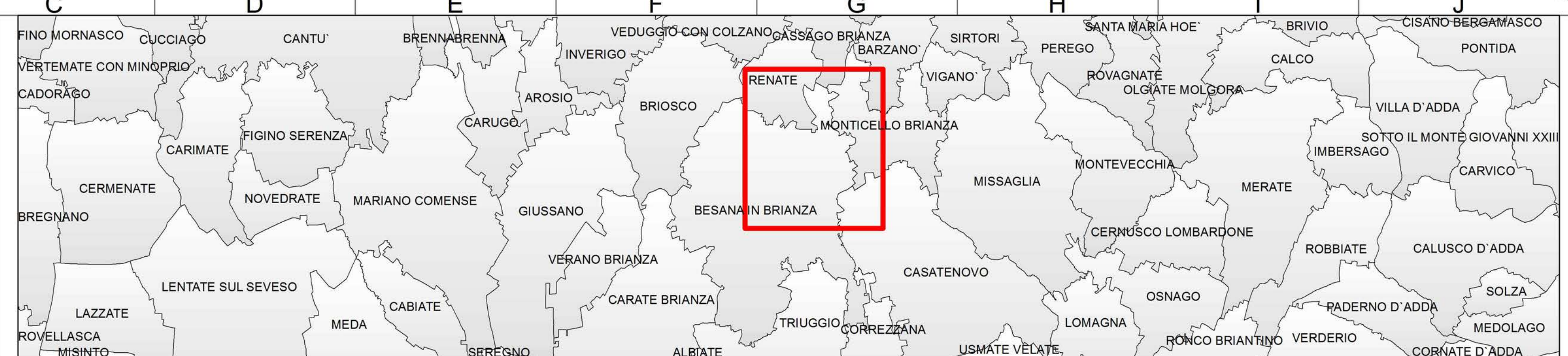
Inquadramento Livello Comunale