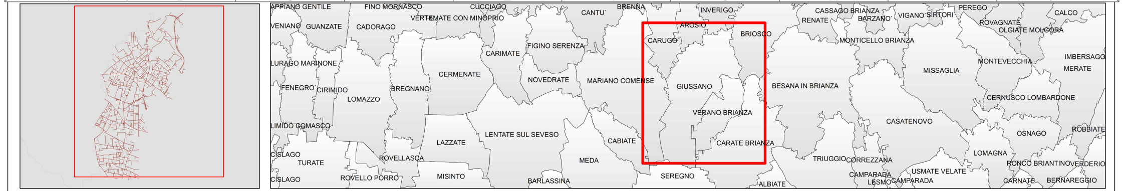
Mapa di Dettaglio